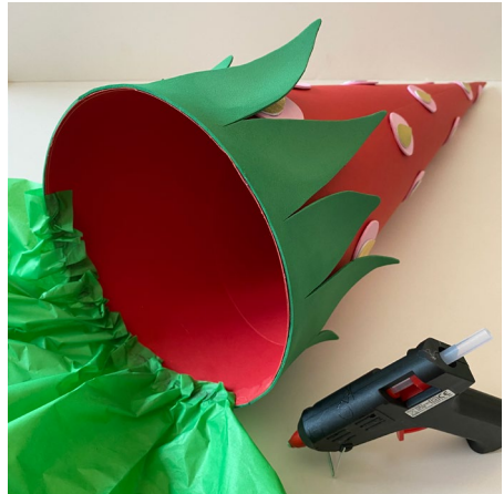
8. Grünes Seidenpapier an der Innenseite der Tüte „wellenartig“ festkleben.