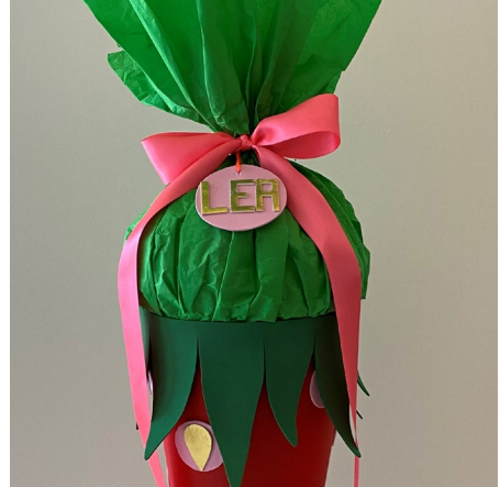
10. Die Tüte mit dem breiten Satinband verschließen und eine Schleife binden – fertig ist die Erdbeer-Schultüte!

Diese und auch viele weitere Anleitungen finden Sie online unter: www.idee-shop.com/anleitungen