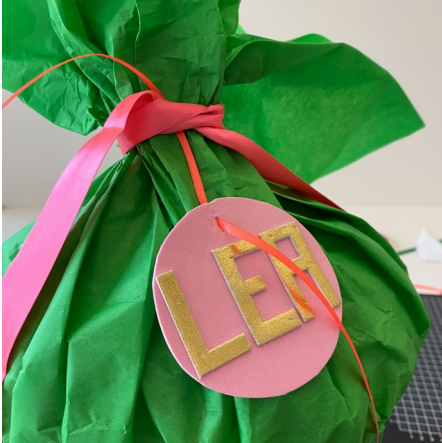
9. Mithilfe der Druckvorlagen „Namensschild“ und „Alphabet“ den Anhänger basteln und diesen mit dem dünnen Satinband an der Schultüte befestigen.