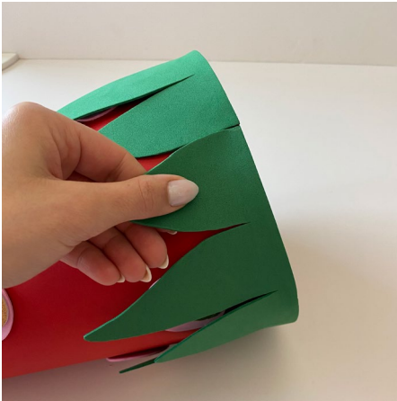
7. Die Zacken des Erdbeergrüns leicht nach außen biegen.